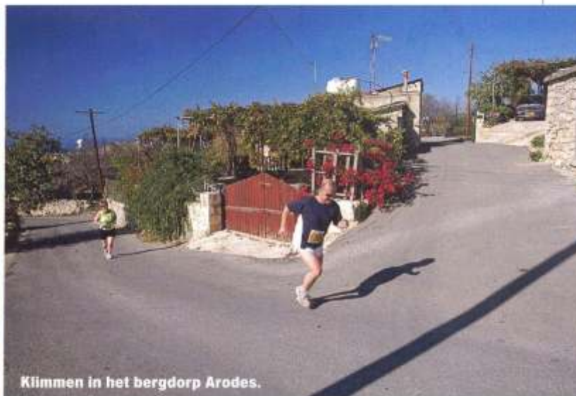
Klimmen in het bergdorp Arodes.