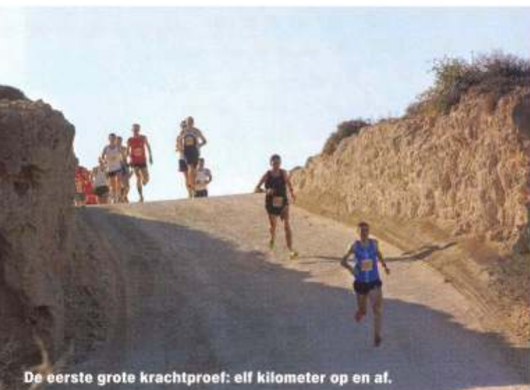
De eerste grote krachtproef: elf kilometer op en af.