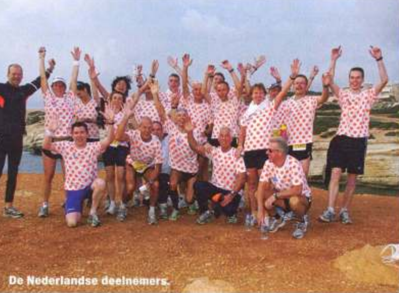
De Nederlandse deelnemers.