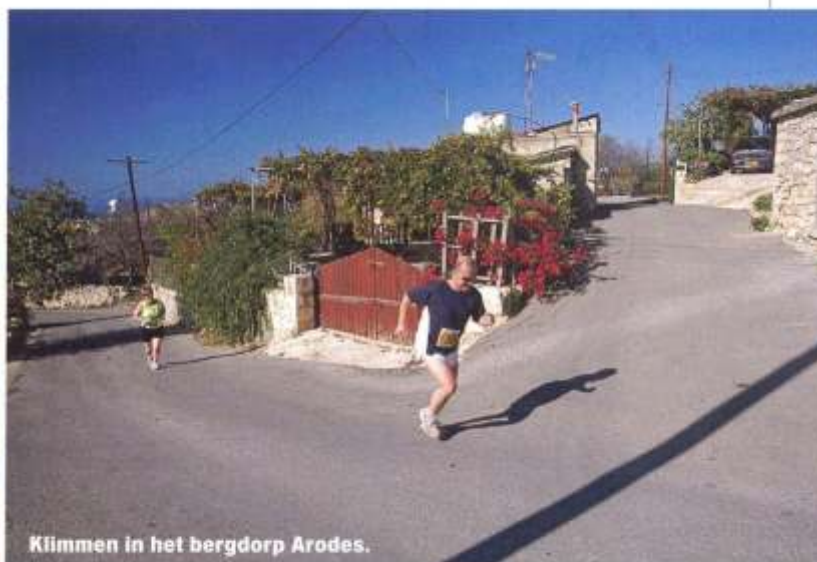
Klimmen in het bergdorp Arodes.