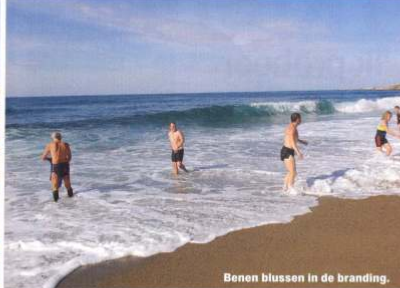
Benen blussen in de branding.

woning op te eisen. Andere huizen zijn veranderd in een bouwval. Vogels vliegen in en uit, weer en wind hebben er vrij spel. Hier en daar zijn de letters EOKA neergekalkt, de naam van de militante Grieks-Cypriotische afscheidingsbeweging. De oude mannen voor het café willen er niet over praten, de kwestie ligt nog steeds gevoelig.